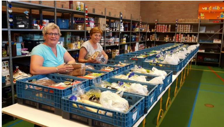
De voedselpakketten worden klaargemaakt.

van Voedselbanken Nederland krijgen we wekelijks producten aangeleverd die doorgaans afkomstig zijn van landelijk opererende bedrijven als Unilever, Hak, Campina en Vion.