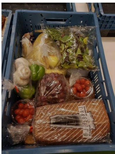
In de krat.

Ook in 2019 hebben we nog steeds gebruik kunnen maken van de door de gemeente Wijk bij Duurstede beschikbaar gestelde ruimte in Langbroek. We hopen er nog lang te mogen zitten. In het jaar 2019 hebben we een gestage groei gezien van het aantal klanten dat een pakket nodig heeft. We begonnen met 49 pakketten. Aan het eind van het jaar waren het er 60. Dat had natuurlijk ook zijn weerslag op het Opslag en Distributiecentrum. Een groei van 24% in klanten betekent ook dat er meer handen nodig zijn en dat de schappen sneller leegraken.