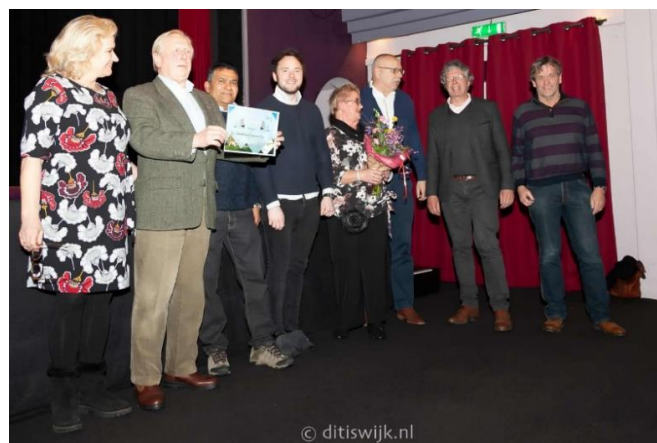
Onze trotse vrijwilligers nemen de prijs in ontvangst.

In 2019 hebben zich 17 nieuwe vrijwilligers aangemeld. Er zijn 7 vrijwilligers gestopt met redenen als: weer of ander werk gevonden, gezondheid, privéomstandigheden of keuze voor ander vrijwilligerswerk.