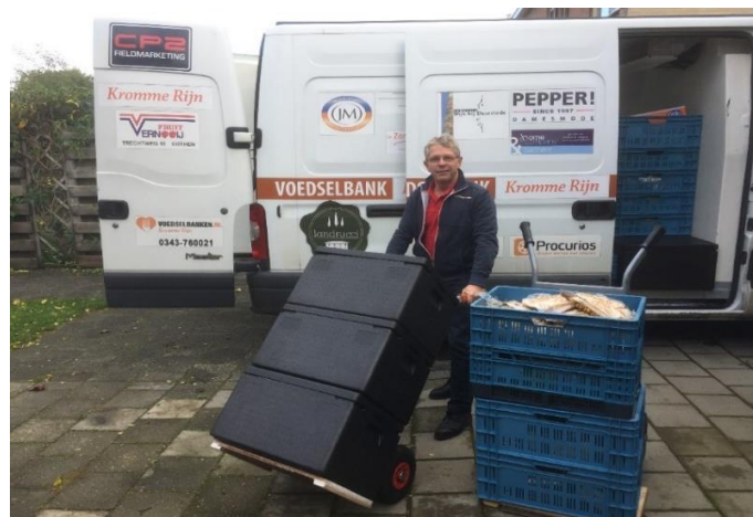
Het laden van de koelbus.

Samen met een coördinator en tweede coördinator zijn zij verantwoordelijk voor het ophalen en afleveren van brood, groente, fruit, vlees, zuivel en frisdrank in de opslag in Langbroek en de uitgiftepunten voor onze klanten. De chauffeurs beschikken over een bestelbus met koelsysteem, dat jaarlijks wordt gecontroleerd. Om veiligheidsredenen en ondersteuning wordt de bus elke rit bemand door 2 personen.